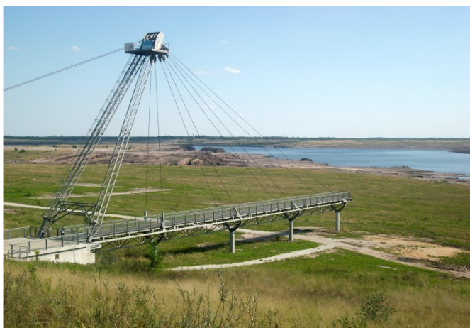
Aufgehender Ilse-See an den IBA-Terrassen Großräschen/Lausitz